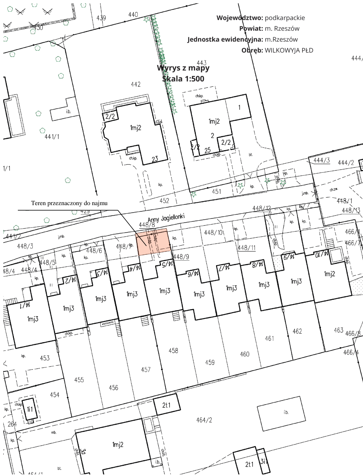
Załącznik nr 2 Uchwała Nr XLVII/989/2021 Z dnia 25 maja 2021 r.